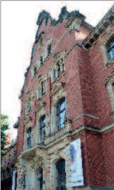
▲ Die ehemalige Reichsbahndirektion Berlin.

Eingezwängt zwischen dem Gleisdreieck und den damaligen Anlagen der Gesellschaft für Markt- und Kühlhallen wurde 1913 der Postbahnhof in der Luckenwalder Straße eröffnet. Die Anlage war notwendig geworden, nach-