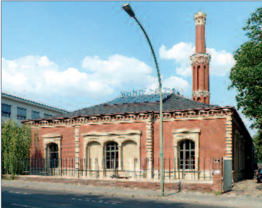
▲ Das ehemalige Pumpwerk des Radialsystems III am Halleschen Ufer.

Der Park Gleisdreieck umfasst die Flächen des ehemaligen Potsdamer und Teile des Anhalter Güterbahnhofs, welche südlich der einstigen Kopfbahnhöhe lagen, und