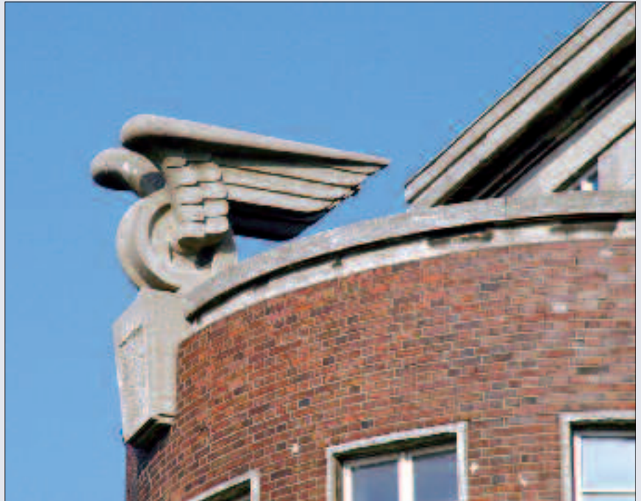
▲ Fassadenschmuck am Westflügel der Reichsbahndirektion Berlin von Richard Brademann an der Luckenwalder Straße.

Ab 1920 befand sich der Sitz der Reichsbahndirektion Berlin in dem Gebäudekomplex, der zwischen 1929 und 1938 um einen