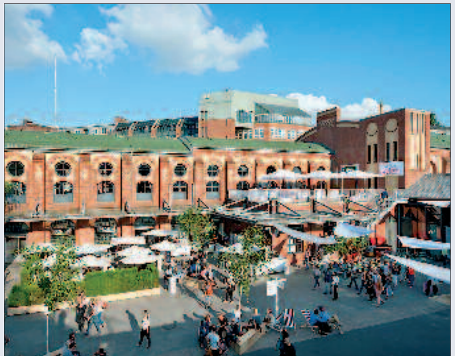
▲ Blick in den Innenhof „Station Berlin“ des ehemaligen Postbahnhofs in der Luckenwalder Straße.

Die Hochbahnstation Gleisdreieck entstand ursprünglich um 1900 als zentrales Verzweigungsbauwerk der ersten Berliner U-Bahnlinien, gelegen zwischen dem Anhalter und Potsdamer Güterbahnhof. Erst 1912/13 wurde die Anlage in Folge des katastrophalen Hochbahnunglücks von 1908 und der geplanten Entlastungslinie zum Wittenbergplatz zu einem Turmbahnhof umgebaut, wie er auch heute noch existiert.