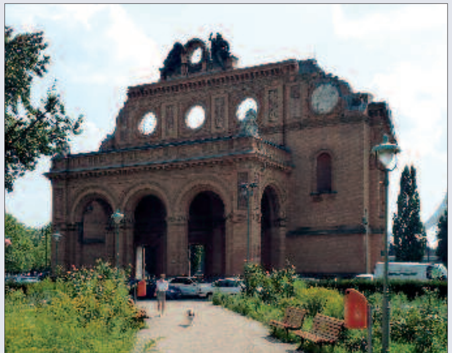
▲ Portikusfragment des Anhalter Bahnhofs am Askanischen Platz.

Der Anhalter Personenbahnhof wurde 1880 eingeweiht und gilt noch heute als einer der bekanntesten deutschen Kopfbahnhöfe. Das von Franz Schwechten entworfene repräsentative Bahnhofsgebäude ersetzte die Anlagen des ersten Anhalter Bahnhofs, die sich bis dahin weitestgehend auf dem Areal nördlich des Landwehrkanals befanden. Heute sind vom Bau der „Mutterhöhle der Eisenbahn“, wie der Anhalter Bahnhof vom Schriftsteller Walter Benjamin genannt wurde, nur noch der Portikus am Askanischen Platz sowie das Fürstenportal erhalten, welches im Deutschen Technikmuseum ausgestellt wird. Daneben sind auch die Originale der zwei Galvanoplastiken vom Portikus, „Der Tag“ und „Die Nacht“ nach einem Entwurf von Ludwig Brunow, zu sehen. Auf dem Portikus befinden sich Kopien. Hinter dem Tempodrom, das heute auf dem Gelände steht, sind auch noch Teile der alten Bahnsteige erhalten und als Landschaftselemente in den Elise-Tilse-Park integriert.