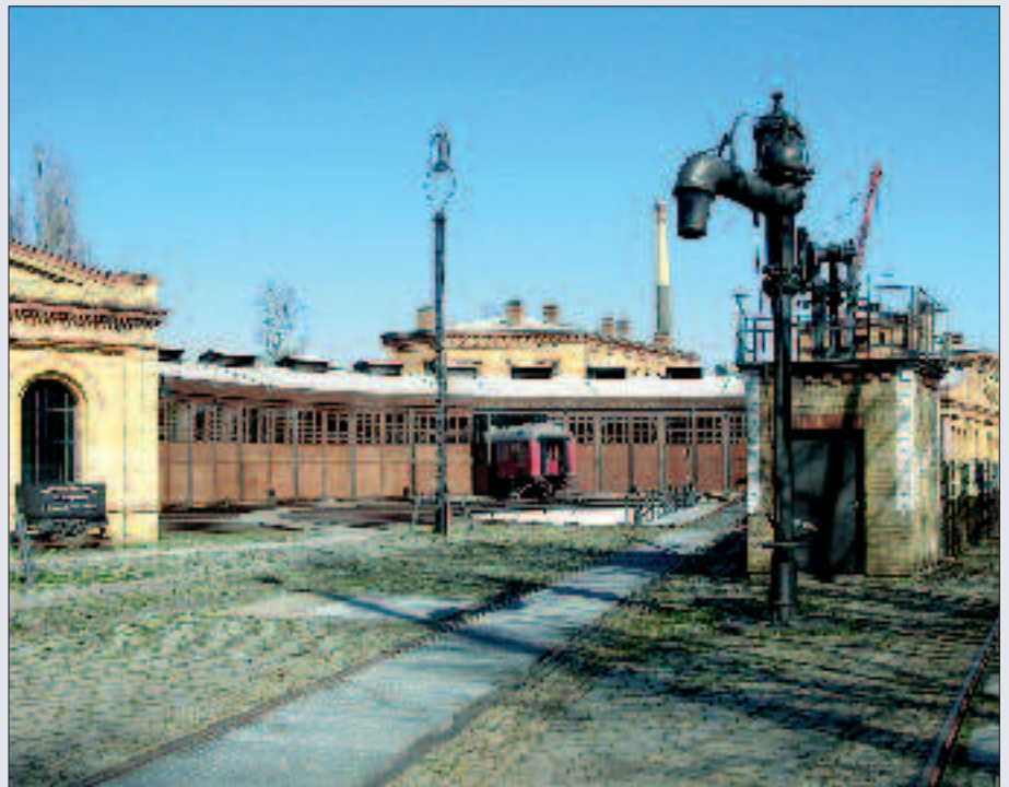
▲ Lokschuppen des Anhalter Bahnbetriebswerks.

Neben den kleinen Zeugnissen im Park finden sich die großen Zeugnisse des Anhalter Güterbahnhofs auf dem Areal des Deutschen Technikmuseums, das sich unmittelbar an den Park anschließt. In dem wieder aufgebauten Lokschuppen des Anhalter