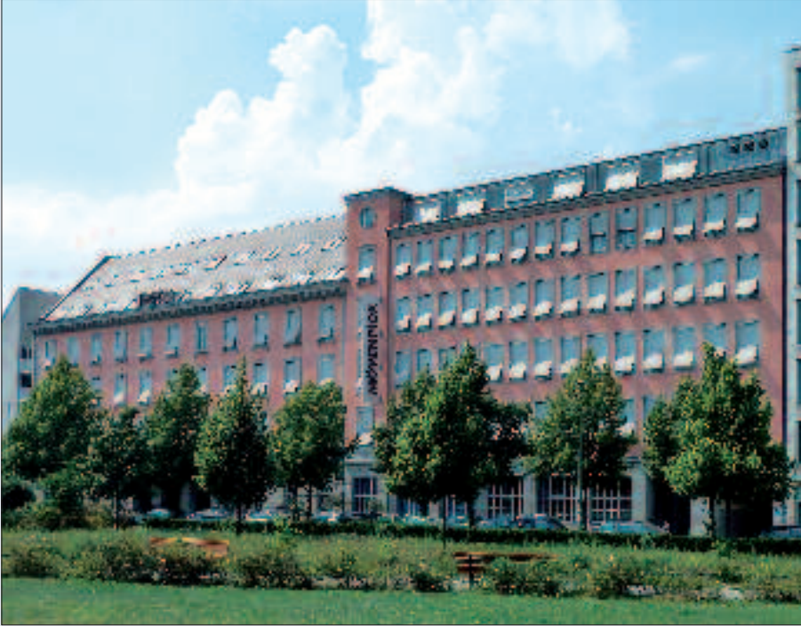
▲ Die ehemalige Siemensverwaltung in der Schöneberger Straße 3, heute ein Hotel der Mövenpick Gruppe.