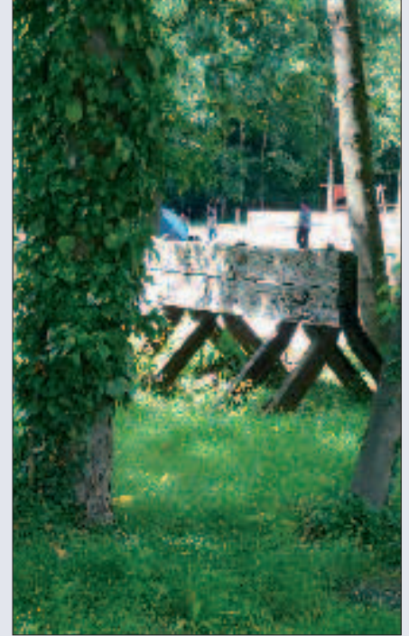
▲ Ein alter Prellbock im Park am Gleisdreieck.

hunderts „zurückeroberte“, bewusst in ihrem jetzigen Zustand belassen und in die Konzeption des Parks als „Gleiswildnis“ integriert wurden. Neben den hoch aufragenden Stellwerken Abwt und Plw – letzteres wurde saniert und beherbergt heute einen Kiosk – sind die Spuren der Berliner Eisenbahngeschichte eher unscheinbar und im Sommer unter dichtem Grün verborgen. Im Wäldchen am Westrand des Parks erkennt man beispielsweise noch die alten Kanalgleise des Wagenreinigungsschuppens, dessen Ruine bis auf das Areal des Technikmuseums reicht. Im Ostteil ist noch eine alte Gleiswaage erhalten und rostige Rangiersignale zeugen von einer längst vergangenen Betriebsamkeit.