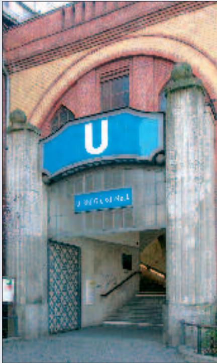
▲ Ein- und Ausgang zur U-Bahnstation „Gleisdreieck“ in der Luckenwalder Straße mit dem Portal von Alfred Grenander.